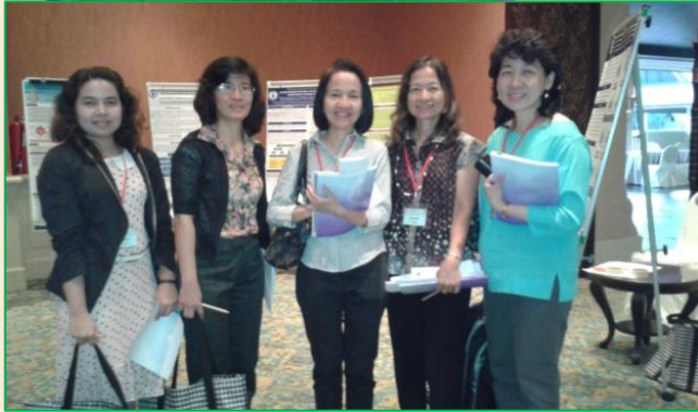
ภาพกรรมการและโปสเตอร์ของผู้นำเสนองานวิจัย

การประชุมครั้งนี้ประสบความสำเร็จอย่างยิ่งสำหรับสถาบันที่จะเป็นเจ้าภาพจัดการจัดประชุมวิชาการครั้งที่ 44 คือ ภาควิชาสรีรวิทยา คณะแพทยศาสตร์ มหาวิทยาลัยเชียงใหม่ แต่เนื่องจากในปีหน้าประเทศไทยเราจะมีการประชุมสำคัญที่ไทยเป็นเจ้าภาพในปลายปีคือ FAOPS 2015 ดังนั้นเพื่อไม่ให้ความซ้ำซ้อนการประชุมกัน ที่ประชุมใหญ่สามัญโดยสมาชิกร่วมกันได้มีมติร่วมกันให้มีการเลื่อนการประชุมประชุมวิชาการครั้งที่ 44 ไปเป็นปี 2559 โดยเจ้าภาพจัดการจัดประชุมครั้งที่ 44 คือ ภาควิชาสรีรวิทยา คณะแพทยศาสตร์ มหาวิทยาลัยเชียงใหม่ ซึ่งคาดว่าจะจัดในช่วงปลายปีที่เชียงใหม่ และเจ้าภาพครั้งต่อไปคือ คณะวิทยาศาสตร์ มหาวิทยาลัยสงขลานครินทร์