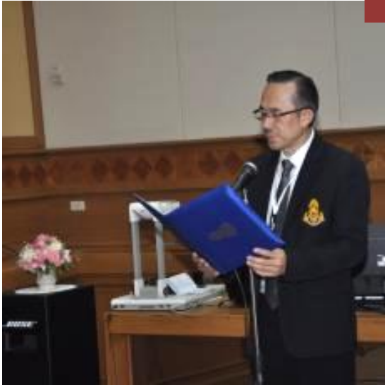
ประธานจัดงาน กล่าวรายงาน