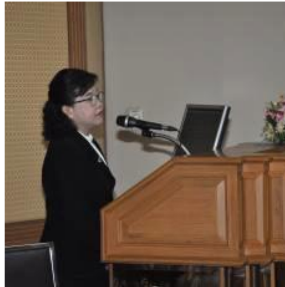
นายกสรีรวิทยาสมาคม แห่งประเทศไทย กล่าวต้อนรับ