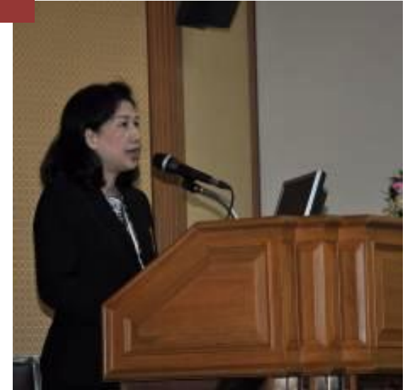
ผู้อำนวยการ กองการศึกษา วิทยาลัยแพทยศาสตร์ พระมงกุฎเกล้ากล่าวเปิดงาน